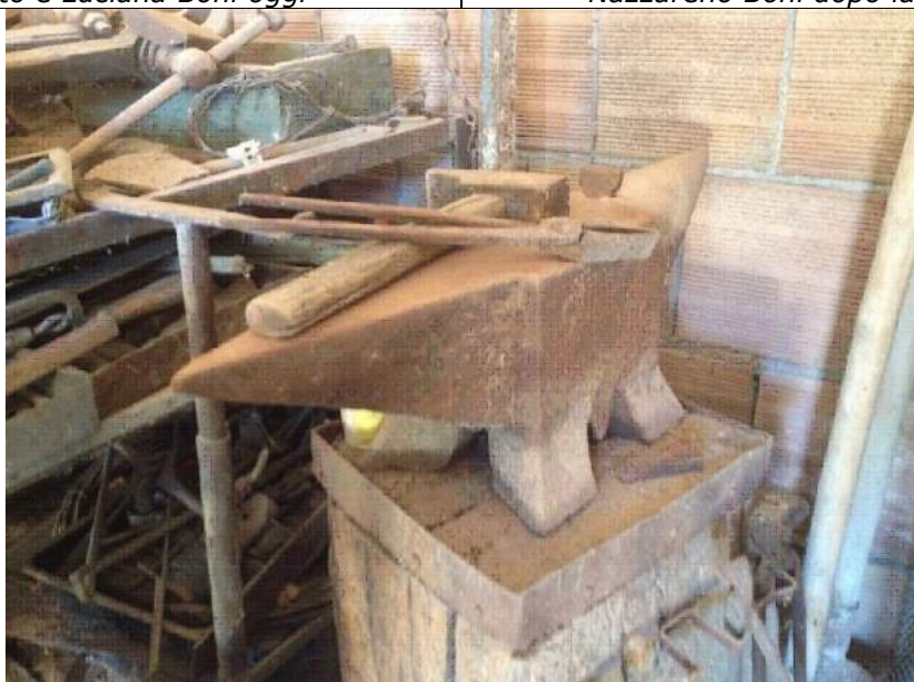
L'incudine conservato da Luciana Boni