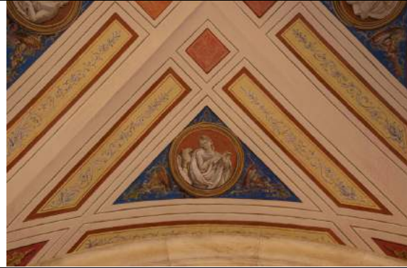
L'Evangelista Giovanni prima e dopo il restauro