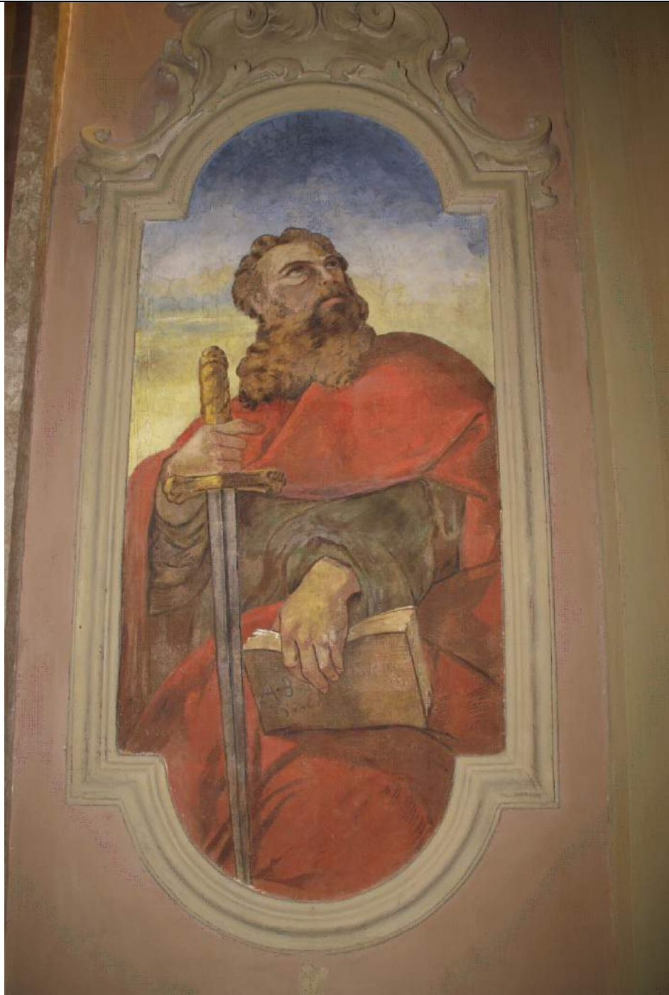
San Paolo dopo l'intervento con la sigla e data del Brugnoli