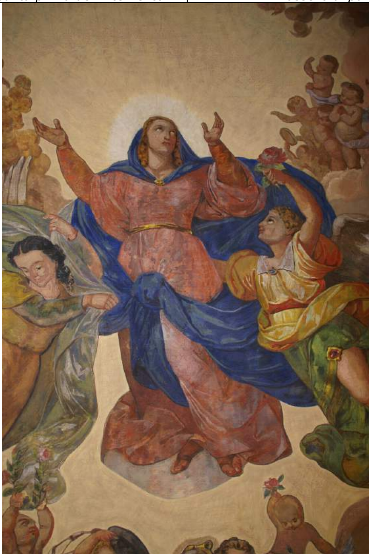
Dipinto dell'Assunta dopo l'intervento