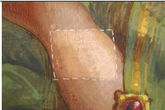
Tassello di pulitura