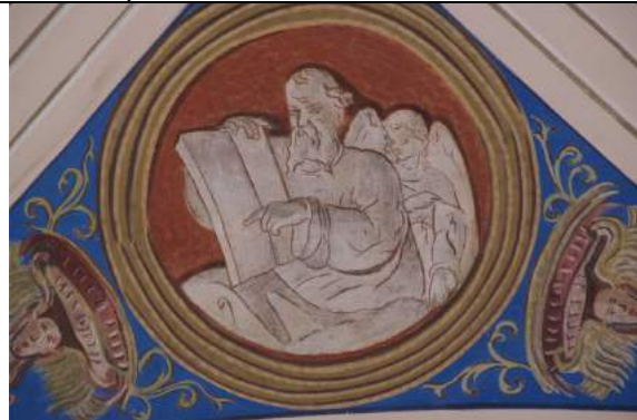
L'Evangelista Matteo prima e dopo il restauro