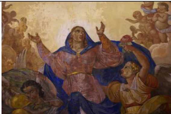
Dipinto dell'Assunta prima dell'intervento